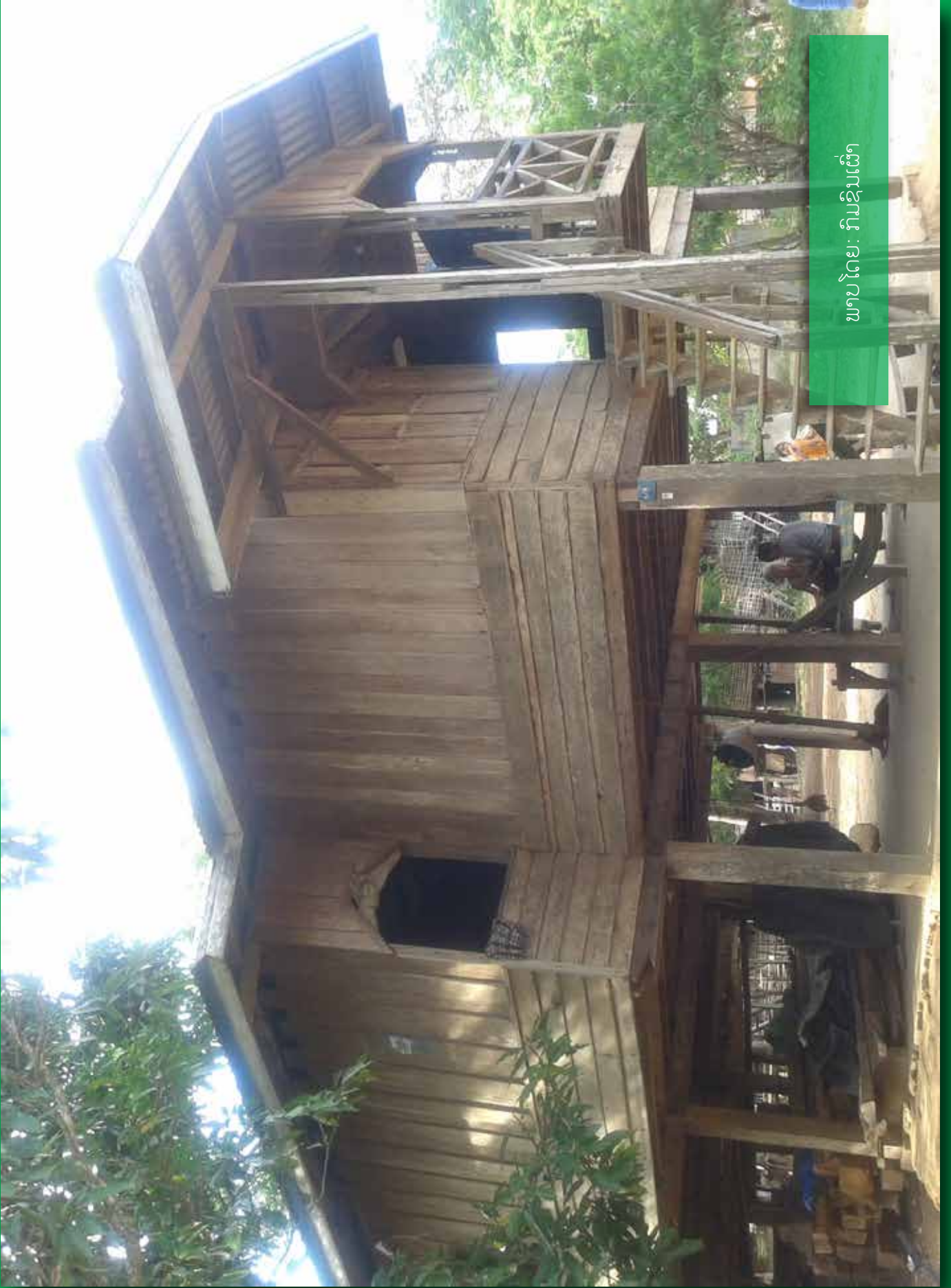
ພາບໂດຍ: រົມឌິນເຜົາ