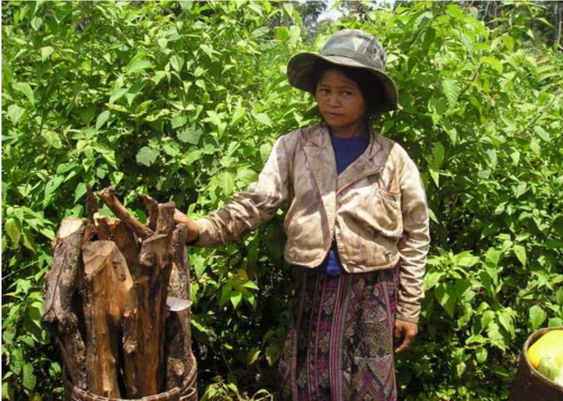
ຮູບທີ 3: ເດັກຍິງ (ຊົນເຜົ່າສ່ວຍ, ລາວເທິງ) ກັບຈາກໄປເອົາໄມ້ຟືນ