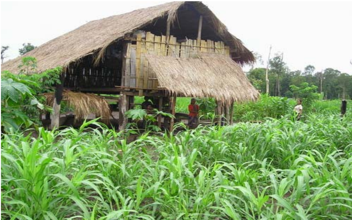
ຮູບທີ 1: ເຮືອນຊົນເຜົ່າປະໂກະທີ່ອ້ອມຮອບໂດຍໄຮ່ສາລີ

ບ້ານ. ນາໄຊ ເປັນບ້ານ ຊົນເຜົ່າສ່ວຍ ຊຶ່ງມາຈາກກຸ່ມພາສາມອນ-ຂະແມ (ໂອສໂຕ-ອາເຊຍຕິກສ໌). ຊຶ່ງໃນປະຈຸບັນລະບົບການຜະລິດກະສິກຳຂອງຊົນເຜົ່າສ່ວຍແມ່ນ ການເຮັດນາ. ພວກເຂົາເຈົ້າປູກເຂົ້າ. ການລ້ຽງສັດມີຄວາມສຳຄັນຕໍ່ສະພາບຊີວິດການເປັນຢູ່ຂອງເຂົາເຈົ້າຫຼາຍ ແລະ ການເກັບເຄື່ອງປ່າຂອງດົງກໍ່ແມ່ນກິດຈະກຳໜຶ່ງຂອງການດຳລົງຊີວິດຂອງເຂົາເຈົ້າ.