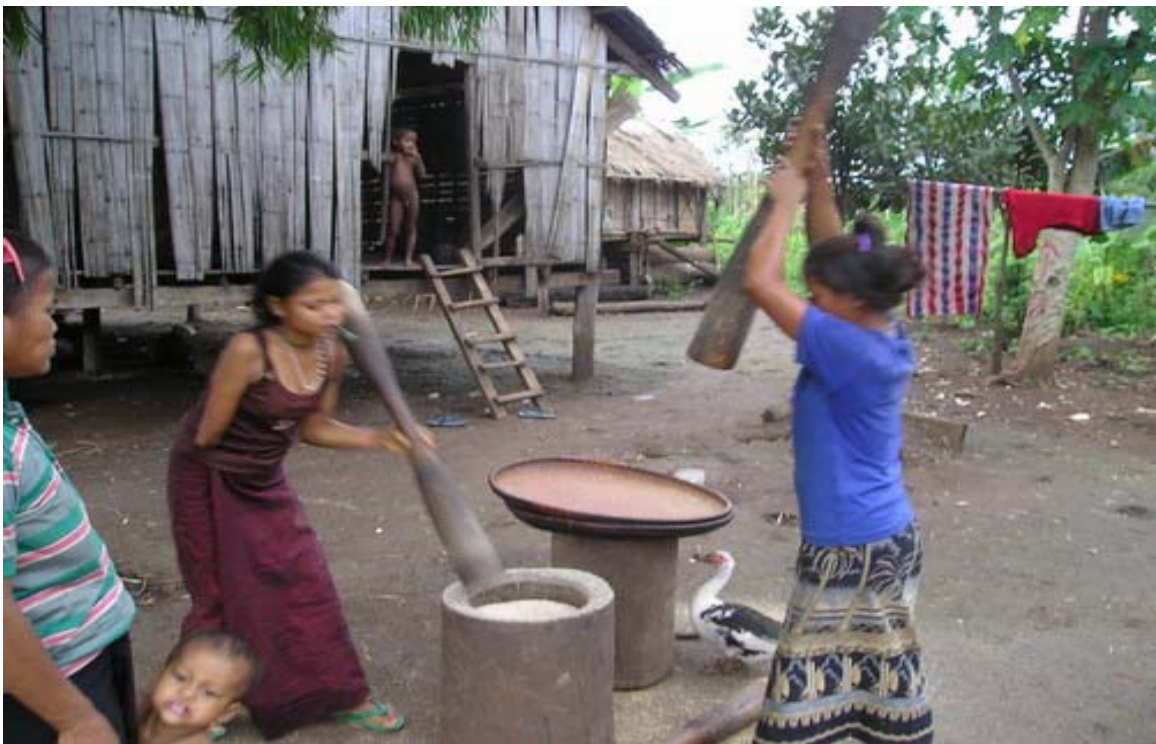
ຮູບທີ 2. ແມ່ຍິງເຜົ່າປະໂກະຕຳເຂົ້າດ້ວຍມື ຊຶ່ງແມ່ນກິດຈະກຳປະຈຳວັນຂອງເຂົາເຈົ້າ (2 ຄັ້ງຕໍ່ວັນ)

ແມ່ຍິງຈະຮັບຜິດຊອບເລື່ອງການຕຳເຂົ້າໂດຍສະເພາະ. ສ່ວນຜູ້ຊາຍຈະລ້ຽງປາ ແລະ ສັດ ໃຫຍ່ສ່ວນສັດປີກ ແລະ ສັດປະເພດນ້ອຍຈະແມ່ນແມ່ຍິງເປັນຄົນລ້ຽງ. ແມ່ຍິງມີບົດບາດສະເພາະ ໃນການເຂັນຟ້າຍ, ຍ້ອມສີ, ຕຳຫຼຸກ ແລະ ຫຍິບແຊ່ວ. ສ່ວນຜູ້ຊາຍຈະມີບົດບາດສະເພາະໃນການກໍ່ ສ້າງເຮືອນ, ຕີເຫຼັກ, ສານແທ ແລະ ກະຕ່າ.