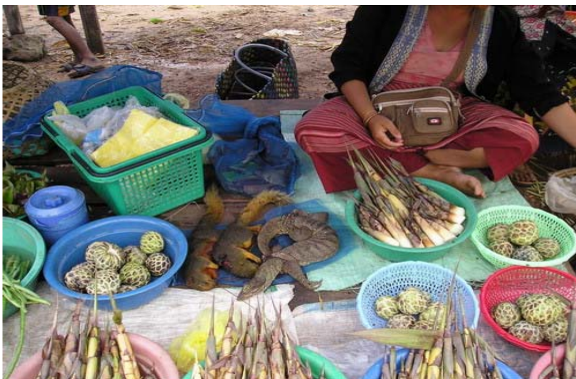
ຮູບທີ 4. ແມ່ຍິງລາວລຸ່ມຂາຍໜໍ່ໄມ້ ແລະ ກະຮອກຕາມແຄມທາງ

ແມ່ຍິງ ຈຳນວນສ່ວນຫຼາຍ (83%) ແລະ ຜູ້ຊາຍ (86%) ເກັບຜະລິດຕະພັນປ່າໄມ້ເພື່ອການບໍລິໂພກຂອງຄອບຄົວ. ແມ່ຍິງປະມານ 32 ສ່ວນຮ້ອຍ ແມ່ນເກັບຜະລິດຕະພັນປ່າໄມ້ເພື່ອຂາຍໃນບ້ານ ແລະ ຕະຫຼາດໃກ້ບ້ານ.