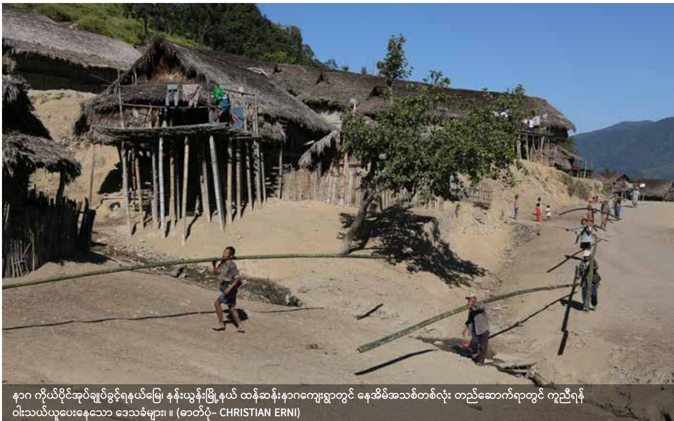
နာဂ ကိုယ်ပိုင်အုပ်ချုပ်ခွင့်ရနယ်မြေ၊ နန်းယွန်းမြို့နယ် ထန်ဆန်းနာဂကျေးရွာတွင် နေအိမ်အသစ်တစ်လုံး တည်ဆောက်ရာတွင် ကူညီရန် ဝါးသယ်ယူပေးနေသော ဒေသခံများ။ ။

ဥပဒေအရ တရားဝင်သည့်အစုအဖွဲ့ဖြစ်လာရန် ပေါင်းစည်းမှုများ (incorporation) လိုအပ်နိုင်သည်။ သို့သော် မဖြစ်မနေမဟုတ်ဘဲ ဆန္ဒအလျောက်သာ ပေါင်းစည်းခြင်းဖြစ်ပြီး ထပ်ဆောင်းအကာ အကွယ်များရရှိနိုင်ရန်အတွက် ဖြစ်သည်။