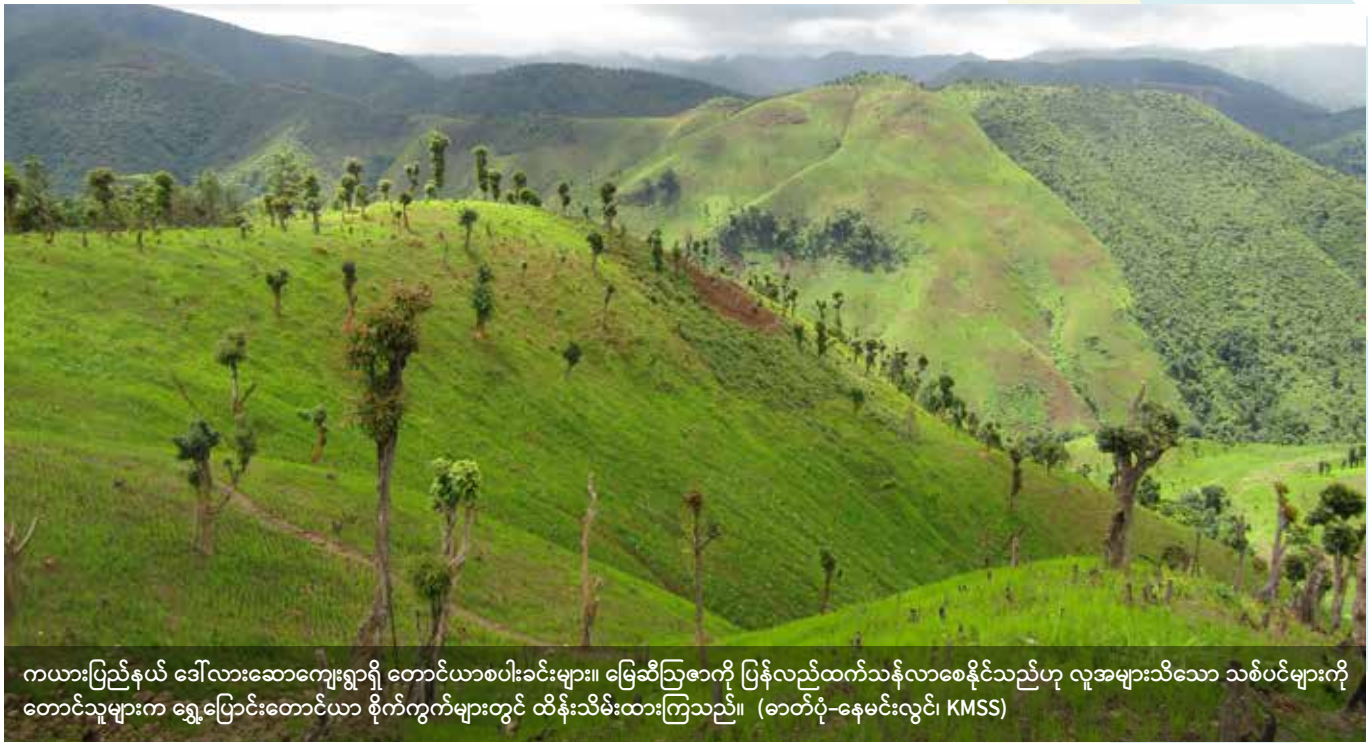
ကယားပြည်နယ် ဒေါ်လားဆောကျေးရွာရှိ တောင်ယာစပါးခင်းများ။ မြေဆီလွှာကို ပြန်လည်ထက်သန်လာစေနိုင်သည်ဟု လူအများသိသော သစ်ပင်များကို တောင်သူများက ရွှေ့ပြောင်းတောင်ယာ စိုက်ကွက်များတွင် ထိန်းသိမ်းထားကြသည်။

ဓလေ့ထုံးတမ်း လုပ်ပိုင်ခွင့်ရန်များတွင် ရပ်ရွာလူထုတစ်ခုကအသုံး ပြုသည့်ဇန်မှသည် တစ်ခုထက်ပိုသည့် ရပ်ရွာလူထုများ အတူတကွ အသုံးပြုသည့်ဇန် သို့မဟုတ် တိုင်းရင်းသားလူမျိုးစုတစ်ခုက စီမံ ခန့်ခွဲသည့်ကြီးမားသည့်နယ်မြေများအထိ ဇန်အမျိုးမျိုး ရှိနေနိုင် သည်။ မြန်မာနိုင်ငံတွင် ကိုယ်ပိုင်အုပ်ချုပ်ခွင့်ရဇန်များကို သို့မဟုတ် တိုင်းရင်းသားပြည်နယ်များတစ်ခုလုံးကို သို့မဟုတ် အချို့အစိတ် အပိုင်းများကို သို့မဟုတ် တိုင်းများတွင်လည်း အချို့အစိတ်အပိုင်း များကို ဓလေ့ထုံးတမ်းလုပ်ပိုင်ခွင့်ရန်များဟု သတ်မှတ်နိုင်သည်။