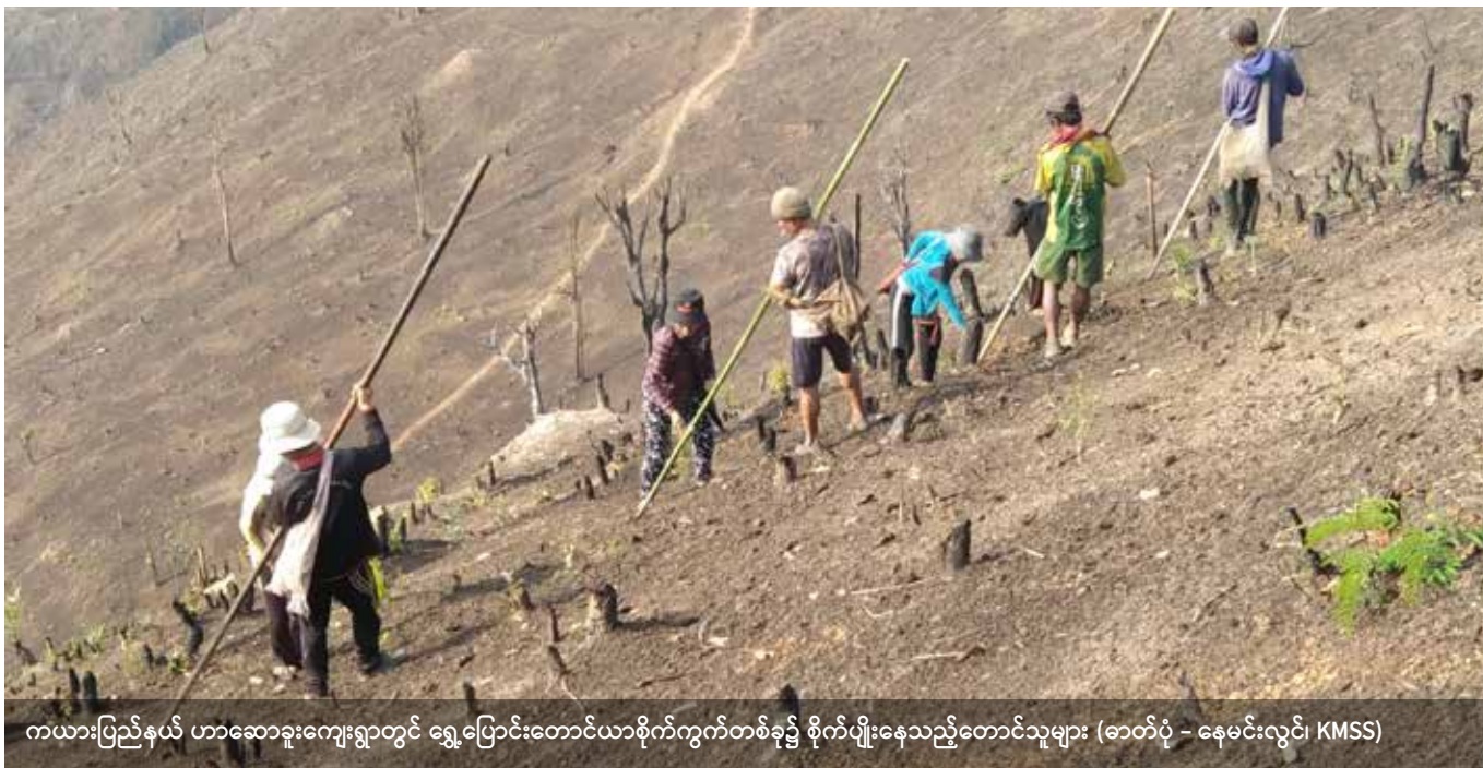
ကယားပြည်နယ် ဟာဆောခူးကျေးရွာတွင် ရွှေပြောင်းတောင်ယာစိုက်ကွက်တစ်ခု၌ စိုက်ပျိုးနေသည့်တောင်သူများ