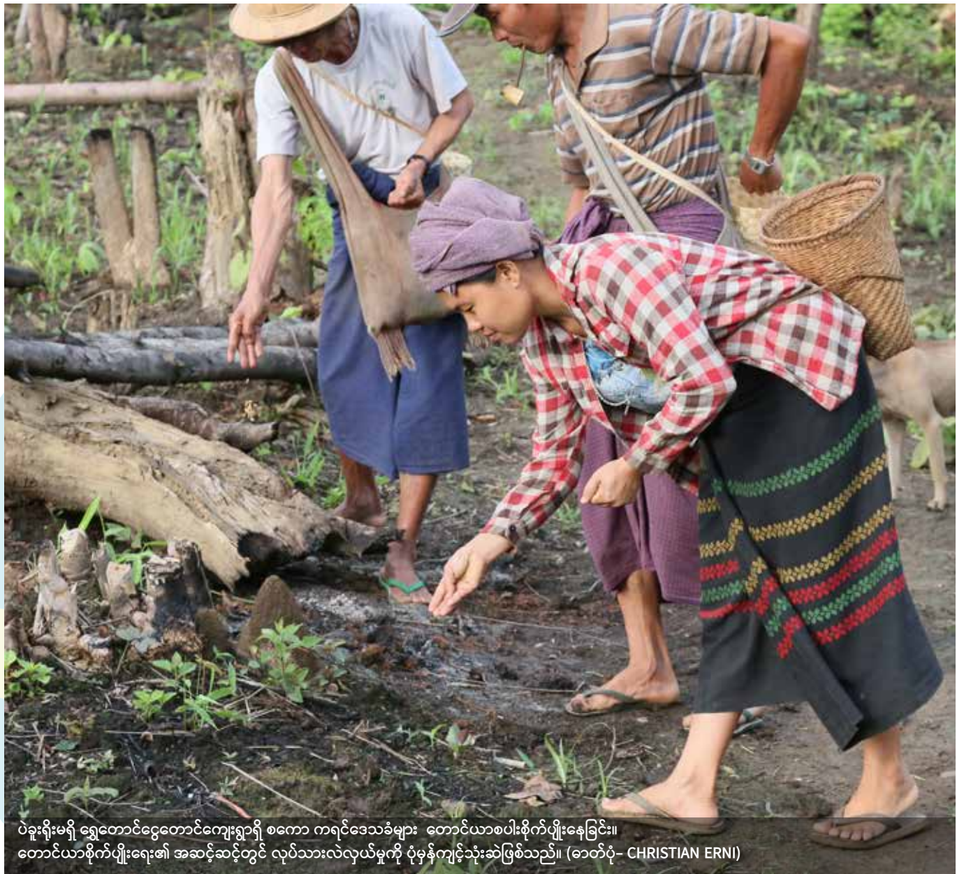
ပဲခူးရိုးမရှိ ရွှေတောင်ငွေတောင်ကျေးရွာရှိ စကော ကရင်ဒေသခံများ တောင်ယာစပါးစိုက်ပျိုးနေခြင်း။ တောင်ယာစိုက်ပျိုးရေး၏ အဆင့်ဆင့်တွင် လုပ်သားလဲလှယ်မှုကို ပိုမိုကျင့်သုံးဆဲဖြစ်သည်။

မြန်မာနိုင်ငံတွင် တိုင်းရင်းသားလူမျိုးစုပေါင်းများစွာ နေထိုင်ကြပြီး ၎င်းတို့မြေများ၊ နယ်နိမိတ်များနှင့် သယံဇာတရင်းမြစ်များအတွက် ရှေးယခင်ကပင် အခွင့်အရေးများ ပိုင်ဆိုင်ခဲ့ကြသူများဖြစ်သည်။ အများစုသည် ကိုယ်ပိုင်အုပ်ချုပ်ပြဋ္ဌာန်းခွင့်ရရန် ဆယ်နှစ်များစွာ ကြာသည့်တိုင်အောင် တိုက်ပွဲဝင်နေကြသည်။ ဓလေ့ထုံးတမ်းအခွင့်အရေးဆိုင်ရာဥပဒေသည် ဤသို့သယံဇာတရင်းမြစ်များအပေါ် ကိုယ်ပိုင် ပိုမိုစီမံအုပ်ချုပ်ခွင့်နှင့် ပိုင်ဆိုင်ခွင့် လိုလားနေကြသည့် တိုင်းရင်းသားလူမျိုးစုများ၏ လိုလားချက်များကို ထည့်သွင်းစဉ်းစား တုံ့ပြန်နိုင်ရန် ရည်ရွယ်သင့်ပါသည်။