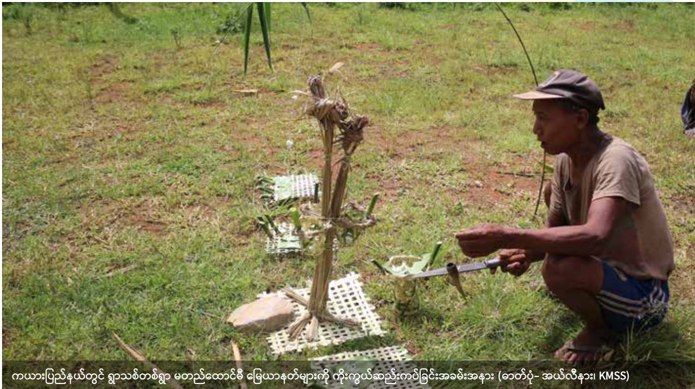
ကယားပြည်နယ်တွင် ရွာသစ်တစ်ရွာ မတည်ထောင်မီ မြေယာနုတ်များကို ကိုးကွယ်ဆည်းကပ်ခြင်းအခမ်းအနား

MRLG သည် မြန်မာနိုင်ငံတွင် ခလေးထုံးတမ်းမြေယာလုပ်ပိုင်ခွင့် အသိအမှတ်ပြုရေးရည်သန်၍ Alliance (မဟာမိတ်) တစ်ရပ်ကို ၂၀၁၈ တွင် ဖွဲ့စည်းခဲ့ပါသည်။ Alliance တွင် အရပ်ဖက်အဖွဲ့အစည်း ၁၀ ဖွဲ့ပါဝင်ပြီး ခလေးထုံးတမ်းမြေယာလုပ်ပိုင်ခွင့် အသိအမှတ်ပြုရေးအတွက် အမျိုးမျိုးသောဥပဒေနည်းလမ်းများကို ဖော်ထုတ်သတ်မှတ်ကာ အမျိုးသားမြေဥပဒေမူကြမ်း ရေးသားပြုစုရေးကို အကူအညီပေးရန် ဖြစ်ပါသည်။ ယခုအချိန်တွင် ထိုဥပဒေမူကြမ်း ပြုစုနိုင်ရေးကို ပါဝင်အားဖြည့်ရန် မဖြစ်နိုင်တော့သော်လည်း အနာဂတ်တွင် ခလေးထုံးတမ်းမြေယာလုပ်ပိုင်ခွင့်များကို မည်သို့ အသိအမှတ်ပြု ကာကွယ်နိုင်မည်နည်းဟူ၍ မူဝါဒရေးဆွဲချမှတ်သူများက အဓိကမေးခွန်းများဖော်ထုတ်ဆွေးနွေးလာနိုင်ရန်အတွက် အကူအညီပေးနိုင်ရန် ဤအစီရင်ခံစာက ယေဘုယျအားဖြင့်ရည်ရွယ်သည်။ ကျေးလက်လူထု၊ တိုင်းရင်းသားလူမျိုးစုများနှင့် ဌာနေတိုင်းရင်းသားတို့၏ ဆန္ဒနှင့်မျှော်မှန်းချက်များကို တုံ့ပြန်ဆောင်ရွက်ပေးနိုင်ရန် ရည်ရွယ်ပါသည်။ ဤအစီရင်ခံစာသည် ရေးသားပြုစုသူများ၏ တင်ပြချက်များနှင့် နည်းပညာပိုင်းဆိုင်ရာ လုပ်ငန်းအဖွဲ့နှင့် Alliance အဖွဲ့ဝင်များ၏ နောက်ဆက်တွဲအကြံပြုချက်များပါဝင်သည့် ထပ်ခါတလဲလဲလုပ်ဆောင်မှု၏ ရလဒ်ဖြစ်ပါသည်။