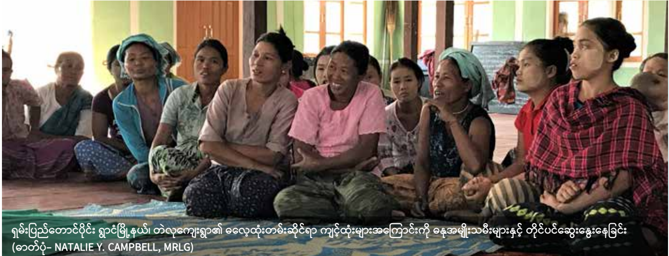
ရှမ်းပြည်တောင်ပိုင်း ရွာငုံမြို့နယ်၊ တဲလုကျေးရွာ၏ ဓလေ့ထုံးတမ်းဆိုင်ရာ ကျင့်ထုံးများအကြောင်းကို ဓနုအမျိုးသမီးများနှင့် တိုင်ပင်ဆွေးနွေးနေခြင်း

ဤနည်းလမ်းသည် နည်းလမ်း ၄ ထက် ပိုမိုရှုပ်ထွေးသည့်အပြင် ရင်းမြစ်များလည်း များစွာပိုမိုလိုအပ်သည်။ အဘယ်ကြောင့်ဆိုသော် မြေကွက်တစ်ခုတိုင်း သို့မဟုတ် မြေကွက်အစုအဖွဲ့တစ်ခုတိုင်းအတွက် အခွင့်အရေးများ တရားဝင်စေရန် လိုအပ်မှုကြောင့်ဖြစ်ပြီး စည်းမျဉ်းစည်းကမ်းများသည်လည်း ရပ်ရွာတစ်ခုနှင့်တစ်ခုမတူဘဲ ကွဲပြားနိုင်ခြင်းကြောင့်ဖြစ်သည်။ ထို့အပြင် အထက်တန်းလွှာများ/ အသာစီးရနေသူများ၏ ကိုယ်ကျိုးရှာသည့် အန္တရာယ်လည်း ရှိနိုင်သည်။ ထို့ကြောင့် ထိုအန္တရာယ်ကိုလျော့ချနိုင်ရန် မြေကွက်လုပ်ပိုင်ခွင့်လက်မှတ်တွင် အခွင့်အရေးများကို ရပ်ရွာလူထုမဟုတ်သူထံသို့ လွှဲပြောင်းခွင့်မရှိစေရဟု သီးသန့်ဖော်ပြရန်လိုအပ်သည်။