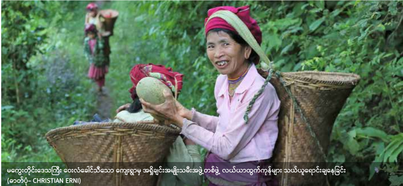
မကွေးတိုင်းဒေသကြီး ဝေးလံခေါင်သီသော ကျေးရွာမှ အရှိချင်းအမျိုးသမီးအဖွဲ့တစ်ဖွဲ့ လယ်ယာထွက်ကုန်များ သယ်ယူရောင်းချနေခြင်း

မြန်မာနိုင်ငံတွင် မြေယာစီမံအုပ်ချုပ်မှုသည် အခြေခံအားဖြင့် နိုင်ငံတော်၏အကျိုးစီးပွား (ပြည်တွင်းအခွန်ဘဏ္ဍာငွေရရှိရေး) သို့မဟုတ် နိုင်ငံတော်အစိုးရနှင့် ဆက်စပ်သူအာဏာရှိသူအသိုင်းအဝိုင်း၏ အကျိုးစီးပွားအတွက်သာ ဖြစ်နေသည်။ မြေစီမံခန့်ခွဲမှုသည် အထက်မှအောက်သို့ အဆင့်ဆင့်သွားသည့် စီမံခန့်ခွဲမှုပုံစံဖြစ်ပြီး ဒေသခံတို့၏ ဆောင်ရွက်ချက်များအတွက် အနည်းငယ်မျှသာ နေရာပေးထားသည်။ ဥပဒေရေးရာပြုပြင်ပြောင်းလဲမှုများ အောင်မြင်နိုင်ရန်အတွက် စီမံအုပ်ချုပ်ရေးဆိုင်ရာယဉ်ကျေးမှုသည် ဝန်ဆောင်မှုကို ပိုမိုအလေးထားသော၊ ဒေသခံတို့၏ လိုအပ်ချက်များနှင့် ကိုက်ညီပြီး တာဝန်ခံမှုရှိသော ယဉ်ကျေးမှုဖြစ်လာရန် လိုအပ်ပါသည်။ အုပ်ချုပ်ရေးဆိုင်ရာ ပြုပြင်ပြောင်းလဲမှုပြုလုပ်ရာတွင် ရပ်ရွာလူထု၏ ထိခိုက်နစ်နာမှုများကို ဖြေရှင်းပေးမည့် ကြီးကြပ်ကွပ်ကဲရေး ကော်မတီတစ်ခု ဖွဲ့စည်းခြင်းလည်း ပါဝင်သင့်ပါသည်။ အခြားနည်းလမ်းတစ်ရပ်အနေဖြင့် ဓလေ့ထုံးတမ်းကိစ္စရပ်များကိုသာ သီးသန့်ကိုင်တွယ်ဆောင်ရွက်မည့် နိုင်ငံတော်အစိုးရအဖွဲ့အစည်းအသစ်တစ်ခု ဖွဲ့စည်းပြီး မတူကွဲပြားသည့် တိုင်းရင်းသားလူမျိုးစုအသီးသီးထံမှကိုယ်စားလှယ်များကို ဝန်ထမ်းခန့်အပ်ကာ စီမံခန့်ခွဲမှုပုံစံအသစ်ကို အစပြုထူထောင်နိုင်ပါသည်။