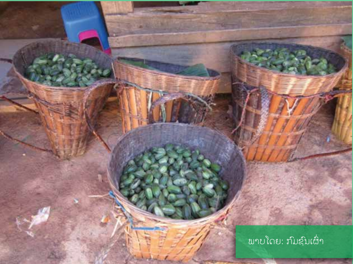
ພາບໂດຍ: រົມຊົນເຜົ່າ