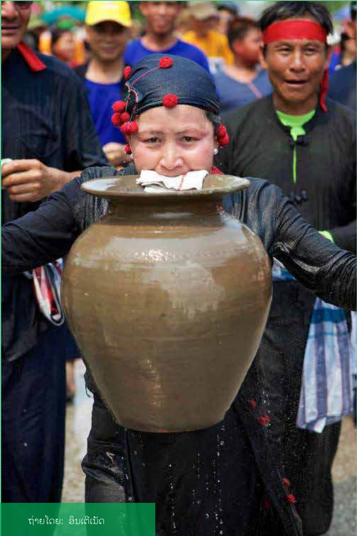
រៀបរយ: អ៊ិនតឺណែត