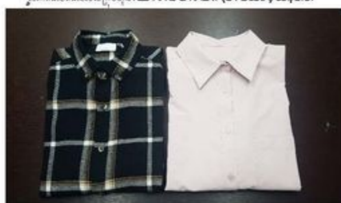
រូបភាពលើគម្រោងរបស់ក្រុមហ៊ុន RED MARS GARMENT (CAMBODIA) CO., LTD.

⚙ · Hide Original · Rate this translation