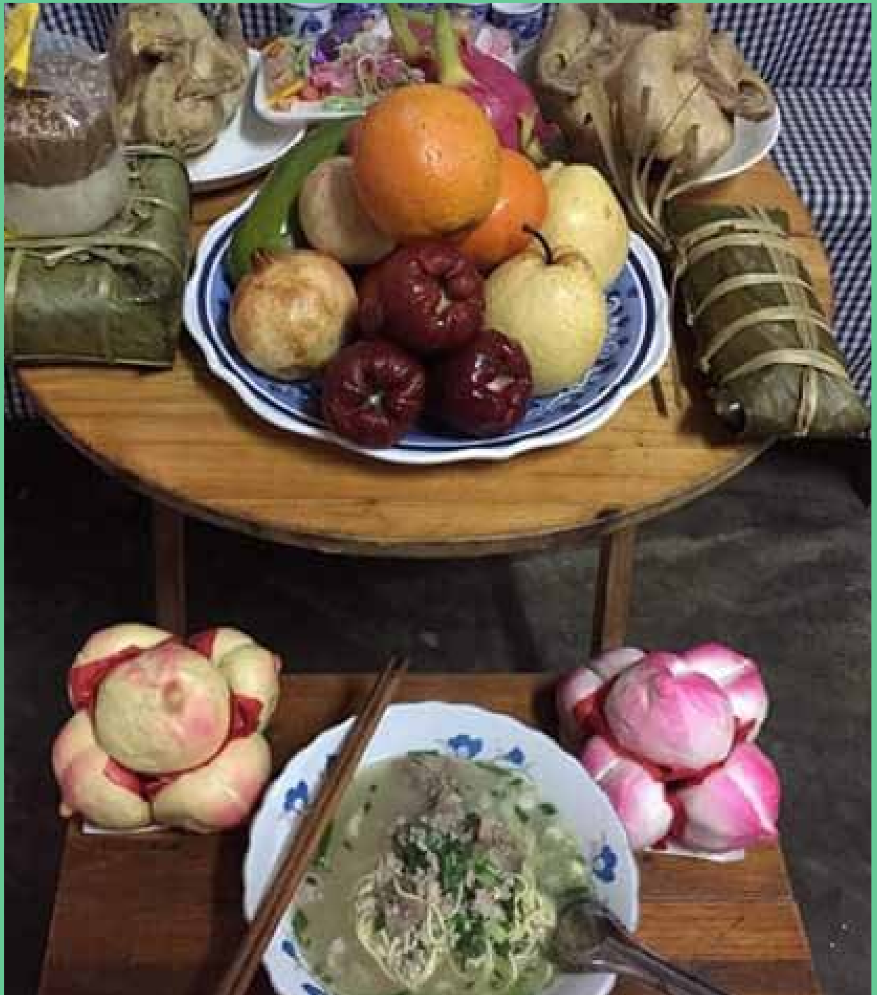
បុរេភិរពេត ພາບໂດຍ: ភົມឌືນເຜີ້າ