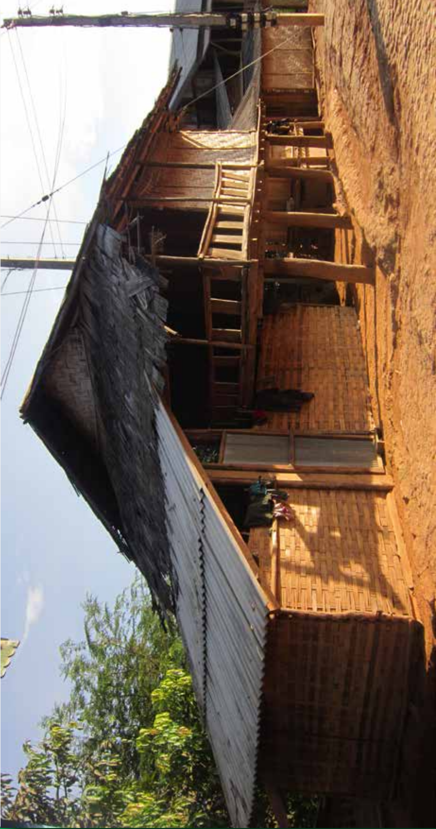
ឃាប​តែ​យៈ រា​ន​ឌុ​ន​ជើ​តា